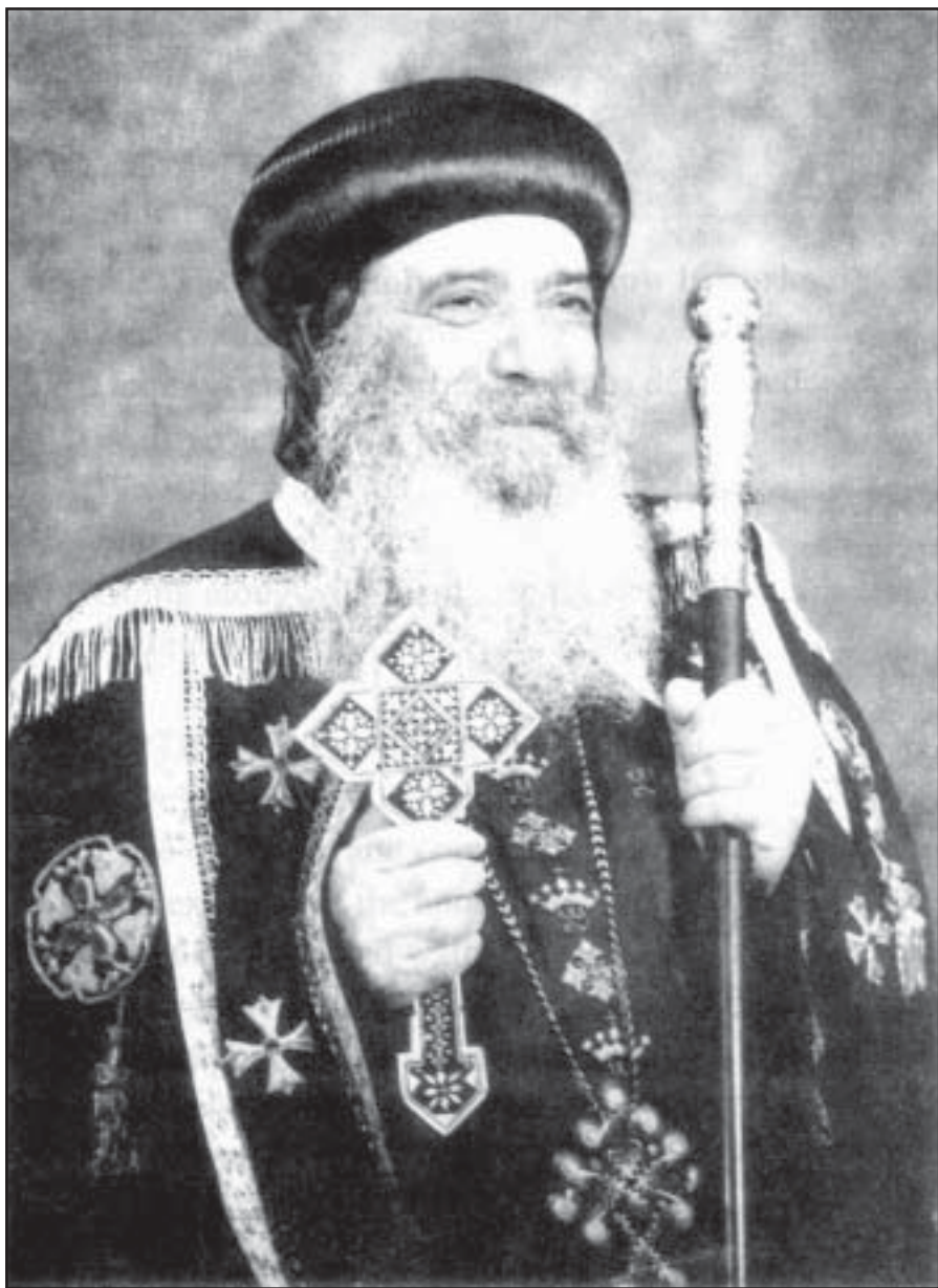
Hans Helighet påve Shenouda III

Den 117:e påven över Alexandria och patriark över S:t Markus stift