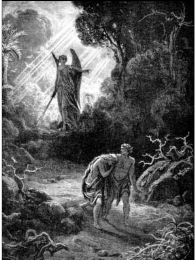
Och han drev ut mannen och satte öster om Edens lustgård keruberna tillsammans med det flammande svärdets lågor för att bevaka vägen till livets träd. (1 Mos 3:24)

Från denna händelse kan vi spåra all ondska idag. Alla deras relationer förgiftades: de gömde sig för Gud, som gett dem allt gott, misstrodde varandra genom att skyla sig och skyllde feigt ifrån sig när Gud konfronterade dem med vad de hade gjort. Då sade Gud “må marken vara förbannad för din skull” 22 , och världen blev sådan som vi ser den idag, med orkaner, jordbävningar och sjukdomar. “Allt skapat har lagts under tomhetens välde, inte av egen vilja utan på grund av honom som vållade det.” 23