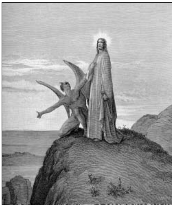
"Gå din väg, Satan." (Matt 4:10)