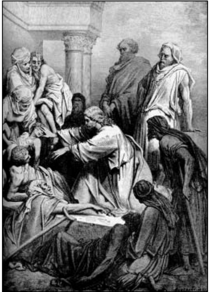
“Stig upp, ta din bädd och gå.” (Joh 5:8)

Sedan kom alltså Jesus, kvinnans säd, som planens höjdpunkt, runt vilken hela tideräkningen kretsar. Gud själv steg ner i den politiska krutdurk som Israel alltid har utgjort för att visa hur vi människor ska leva: ett liv intimt sammanlänkat med Gud. Jesus sade: “Jag är vinstocken, ni är grenarna. Om någon är kvar i mig och jag i honom, bär han rik frukt; utan mig kan ni ingenting göra.” 35 Redan i Gamla Testamentet sade Gud: “Jag skall låta min Ande komma i ert bröst och göra så, att ni vandrar efter mina stadgar och håller mina lagar och gör efter dem.” 36 Denna gemenskap är Guds mål, och det sätt han handlar på syftar till att föra människor in i denna relation. Mer om detta i kapitlet om “Soul-Building Defense”.