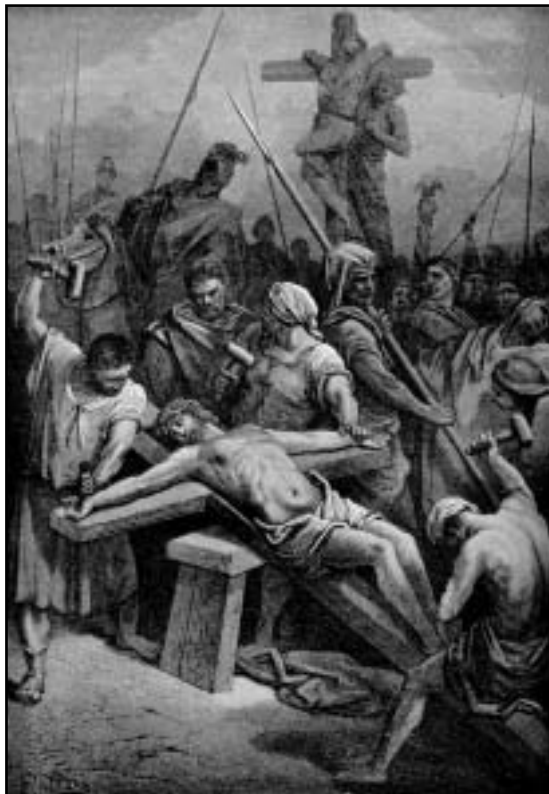
Straffet var lagt på honom, för att vi skulle få frid, och genom hans sår blir vi helade. (Jes 53:5)