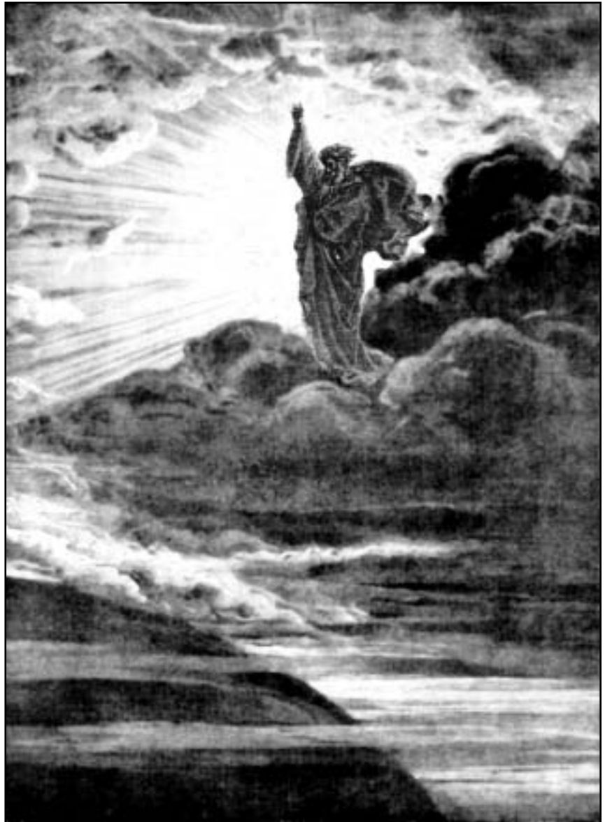
“Varde ljus!” (1 Mos 1:3)

"Hur har du inte fallit från himmelen, du strålande morgonstjärna! Hur har du inte blivit fälld till jorden, du folkens förgörare! Det var du som sade i ditt hjärta: 'Jag vill stiga upp till himmelen, högt ovanför Guds stjärnor vill jag ställa min tron, jag vill sätta mig på gudaförsamlingens berg längst uppe i norr. Jag vill stiga upp över molnens höjder, göra mig lik den Högste.'" 14