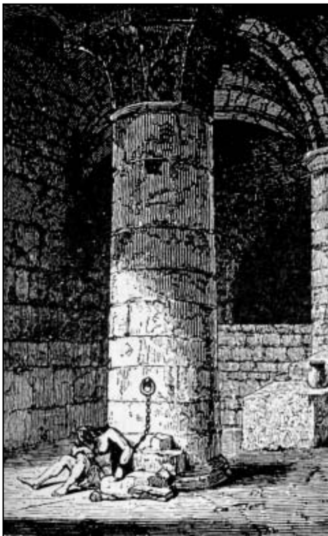
Och om de läggs bundna i kedjor och fångas i eländets snaror, så vill han därmed visa dem vad de har gjort, och vilka överträdelser de har begått i sitt högmod. (Job 36:8-9)

Detta fråntar dock inte syndaren hans ansvar för sin onda handling. Judas förrådade ju Jesus och fick honom dödad, vilket Gud vände till att ge liv och frälsning åt de människor som tror på honom. Ändå skedde sveket av fritt val, och Jesus vittnade om att Judas blev fördömd, när han talar om lärjungarna: “Och jag skyddade dem, och ingen av dem gick under utom undergångens man, ty skriften skulle uppfyllas.” 111 Det var inte en god handling, utan en handling med ont uppsåt och ont resultat som Gud ändå lät godhet komma ur.