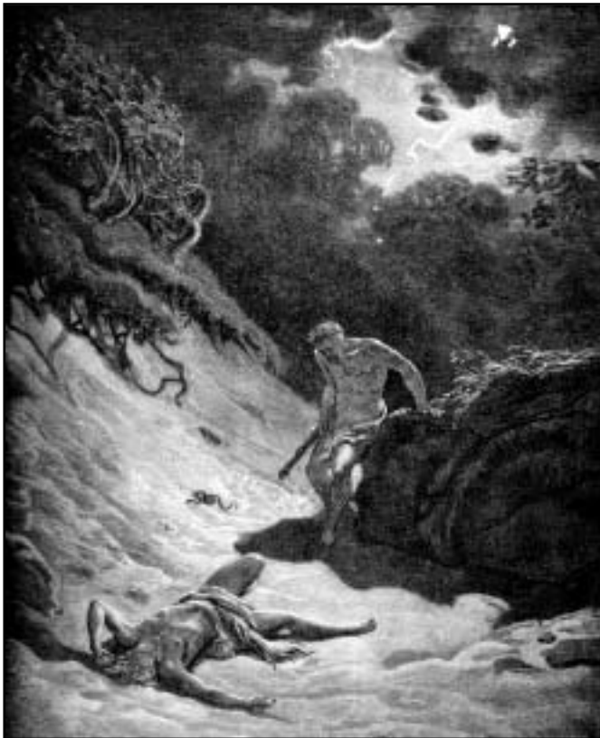
“Skall jag ta vara på min broder?” (1 Mos 4:9)

Ondskans frön slog rot i människan, och redan i andra generationen kommer avundsjuka och mord in. Den andliga döden gick nämligen i arv. Bibeln berättar vidare om att “När Gud skapade människor, gjorde han dem lika Gud... När Adam var 130 år gammal, födde han en son som var honom lik, hans avbild...” 24 . Varje barn som fötts efter syndafallet har kommit in i världen utan andligt liv, och utan Gud har människan varit lätt för djävulen att fresta och påverka. Paulus skrev till de kristna församlingarna att “Ni var döda genom era överträdelser och synder den gång ni levde i dem på denna tidens och världens vis och lät er ledas av fursten över luftens rike, över den andemakt som nu är verksam i olydnadens människor” 25 . Efter syndafloeden fällde Gud omdömet att “människans hjärtas uppsåt är ont allt från ungdomen” 26 . Denna tendens hos människan att ständigt välja sig själv och det onda framför Gud, medmänniskor och det goda kallas köttet i Bibeln, ty det är lika mycket en del av oss som vår egen kropp.